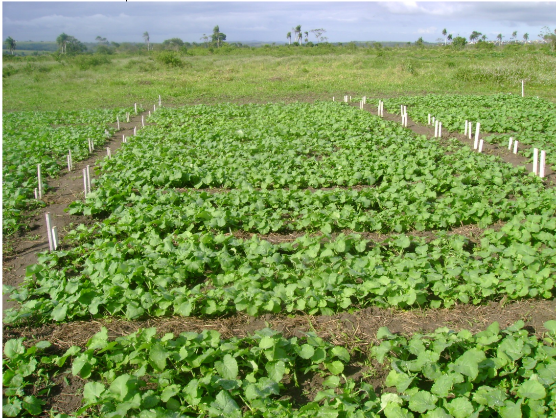
Fig. 2. Aspecto geral do experimento aos 23 dias após a emergência (17/8/07), denotando adequado estabelecimento e densidade de plantas.

Na semeadura foram aplicados 300 kg/ha do fertilizante da fórmula 06-24-12. Em 10 de agosto de 2007 foram aplicados em cobertura 120 kg/ha de nitrogênio na forma de uréia, manualmente ao lado de cada uma das fileiras de plantas. No início da floração, em 3/9/2007, realizou-se adubação foliar com o Albatroz, fonte de NPK e micronutrientes visando a reduzir o abortamento de flores.