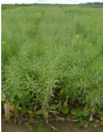
Passo Fundo, RS 2008